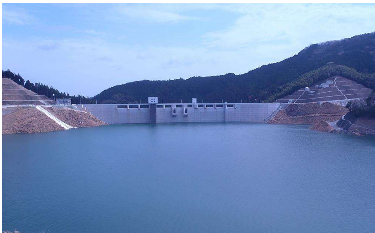
伊良原ダム(福岡県京都郡みやこ町)